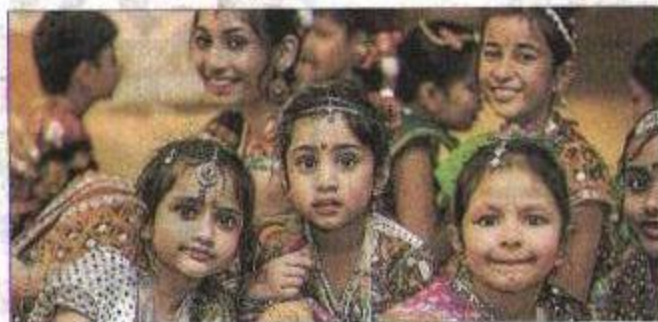
Det er dem her, det handler om - børn fra Indien.

Pludselig blev der fra salen budt på en hurtig omgang mandestrip, og hårdt presset