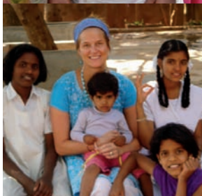
Private snapshot fra hjælpeprojektet i Indien.