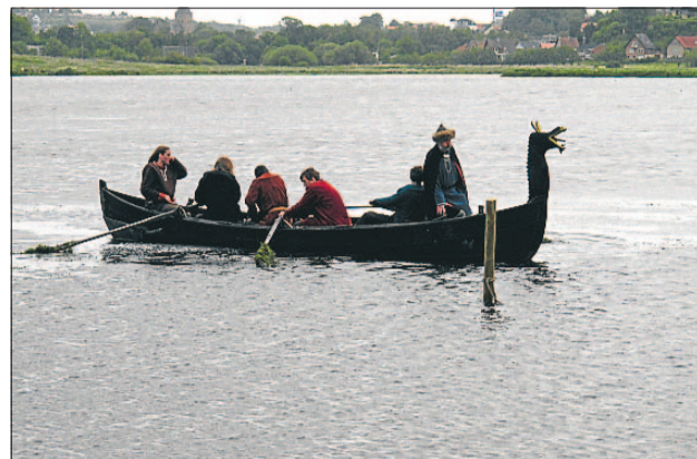
Ideen med at lade kongen komme sejlede i vikingeskib blev særdeles positivt modtaget af publikum.